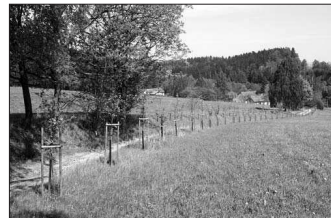
Výsadby v katastru Rusínova