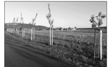
Výsadba v okolí Bezděkova